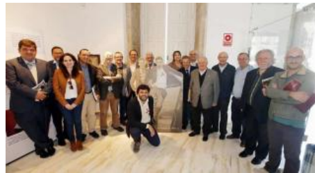
Algunos de los asistentes a la inauguración posan con una silueta de Isla Couto de joven.

Ofrecer al visitante una imagen lo más completa posible del intelectual Xaime Isla Couto (Santiago, 1915-Vigo, 2012) y hacer justicia a su figura, que durante muchos años ha permanecido en un segundo término, es el objetivo de la exposición "Xaime Isla. Raíz e utopía de Galicia", que se inauguró ayer -en el mes en que se cumple el centenario de su nacimiento- en la Casa Galega da Cultura de Vigo y que podrá visitarse hasta el 2 de noviembre.